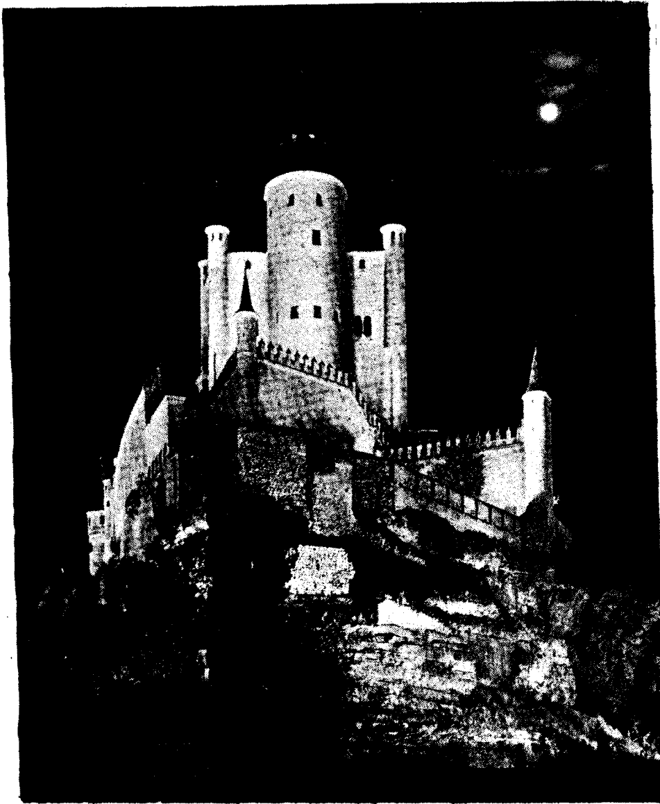
EL ALCAZAR DE SEGOVIA.