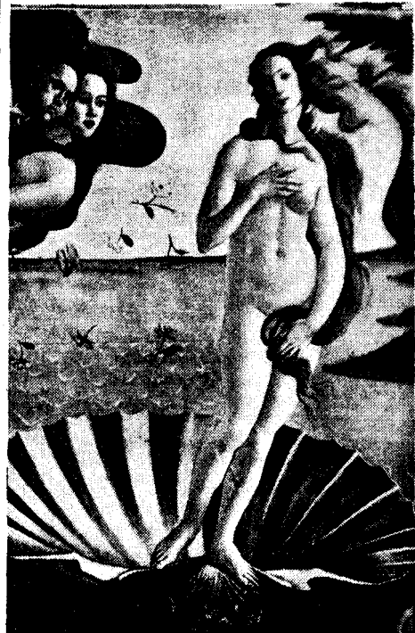
El nacimiento de Venus, detalle del cuadro de Sandro Botticelli.

He llamado siempre a Florencia la "ciudad novia" (y he ido a ella cada vez que he llegado a Europa) porque en su historia, en su belleza y en su arte es la promesa, o la prometida —la ciudad que pudiera ser nuestras pequeñas ciudades si nosotros, en vez de creer que el hombre ha sido hecho para el dinero, nos convenciéramos de que el dinero ha sido hecho para el hombre.