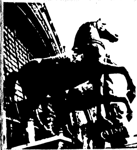
Los corceles de Venecia

Cuando cayó Roma, dividida primero e invadida luego por los bárbaros, el emperador Justiniano, admirablemente secundado por su esposa Teodora —se propuso continuar el esplendor de su imperio en el límite de Europa, en el Bósforo. Constantinopla pasó a ser el centro del mundo civilizado. La nueva Roma de Oriente. La Roma q' llegó hasta nosotros en su tradición jurídica—la del Digesto, la de los Pandectas y de la Instituta: la Roma del "Derecho Romano" no fue la de Augusto, sino esta Roma bizantina que también levantó —en un mestizaje incomparable de oriente y occidente— una arquitectura como la de la Basilica de Santa Sofía, y un arte, como el de sus mosaicos, jamás igualados. Símbolo del poder de esa Roma eran cuatro enormes caballos de bronce, hechos en Alejandria, tres siglos antes de Cristo, robados luego por Roma y trasladados después frente al Bósforo por Justiniano.