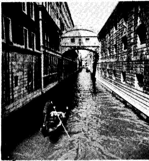
El Puente de los Suspiros

Que no era una farsa el celo y aun el orgullo q' el veneciano desplegaba y sentía por sus sistema político, lo ven mis ojos, no sin sorpresa, cuando entro al "enorme y delicado" Palacio Ducal y en la inmensa sala donde se reunía el Gran Consejo —alarde de arquitectura con sus 50 metros de largo y 25 de ancho sin una sola columna que sostenga el pesado y lujoso artesonado del cielo— recorro los retratos de los Duces que en lo alto de las paredes circundan todo el salón, y al llegar al año 1295, en vez de retrato veo la pintura de una siniestra tela negra y al pie esta inscripción: "Hic est locus Marini Faletri, decapitati pro crimínibus". Con el título de "criminal", no sólo fue decapitado, sino excluida la efigie de Marin Faliero porque trató de convertirse en dictador. Igual suerte corrió en 1310 el Dux Bajamonte Tiepola, a quien, por buscar el auxilio extranjero para organizar una tiranía, la implacable Venecia lo llevó al patíbulo y le